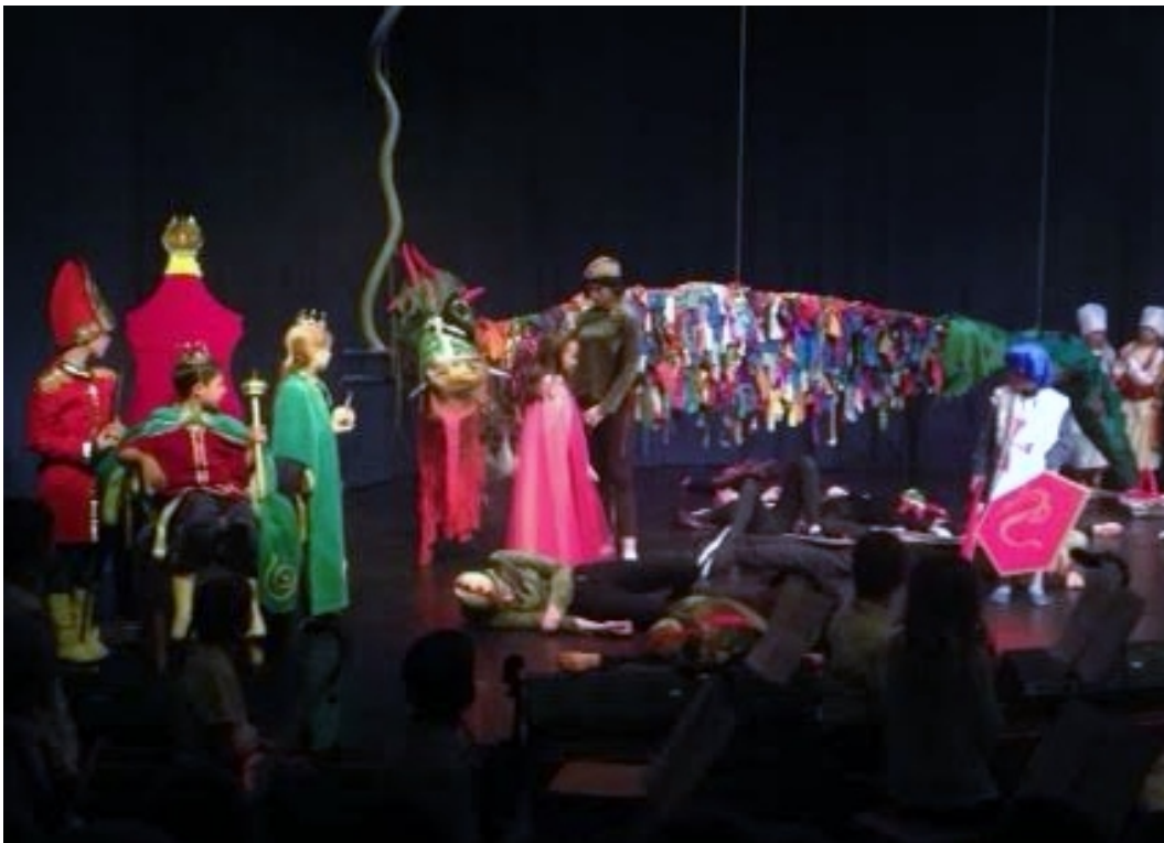
Sankt Örjan dräper draken med hjälp av 2B, 1B, 6B, 7B och 8B.

Penninginsamling - Arbetet med penninginsamling för kulturreisan (på tolv) börjar nu på allvar. Eleverna skall själva initiera, planera och verkställa olika sätt att samla in pengar på.